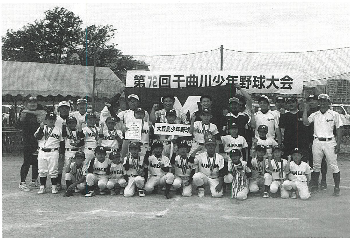
第72回千曲川少年野球大会 野球教室（令和5年5月28日）